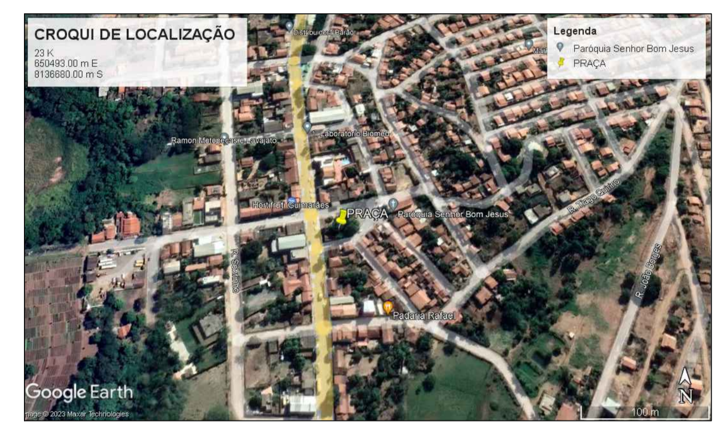
3 CROQUI DE LOCALIZAÇÃO SEM ESCALA