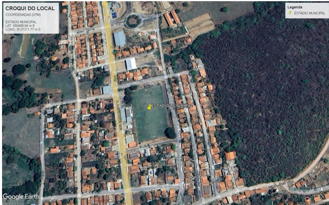
Imagem: Croqui de localização do Estádio Municipal.