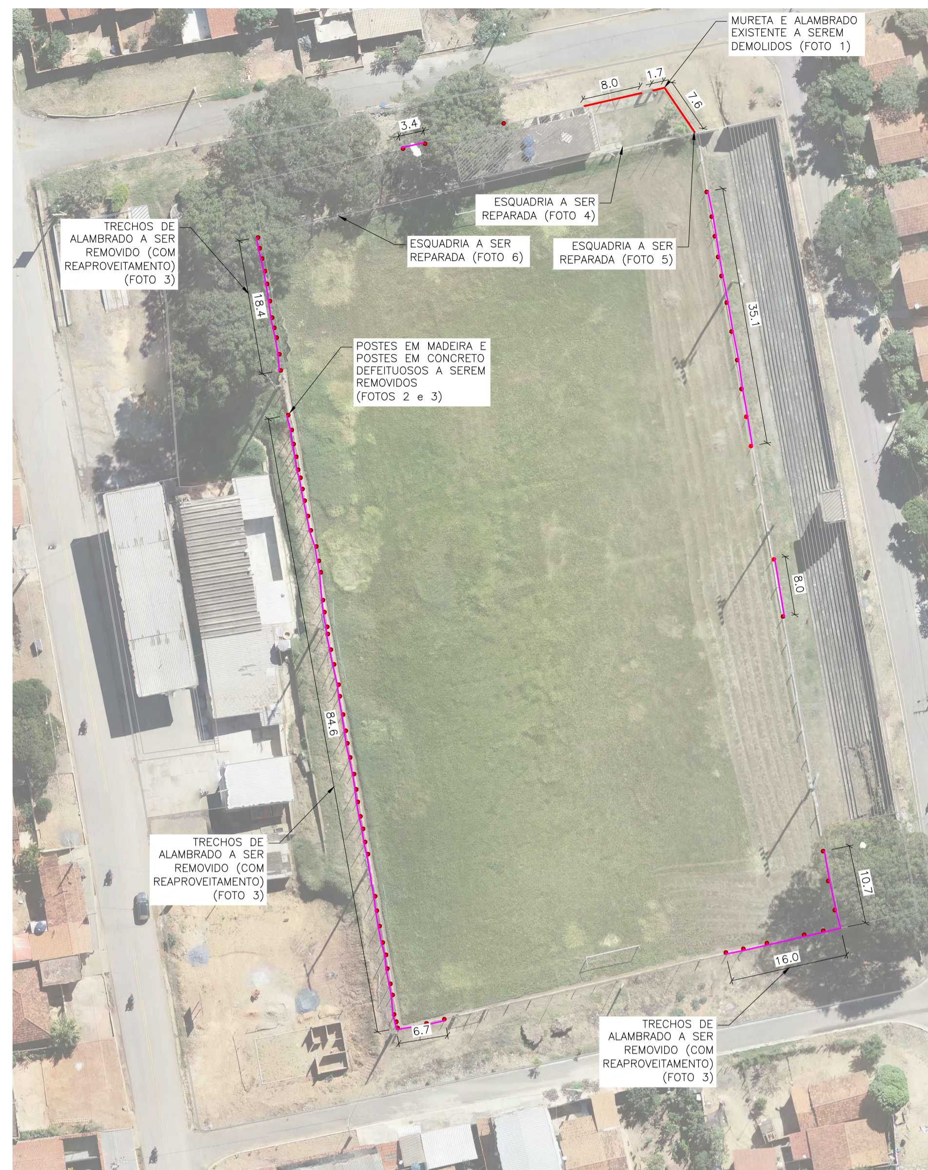
2 DEMOLIÇÕES E REMOÇÕES ESCALA 1:500