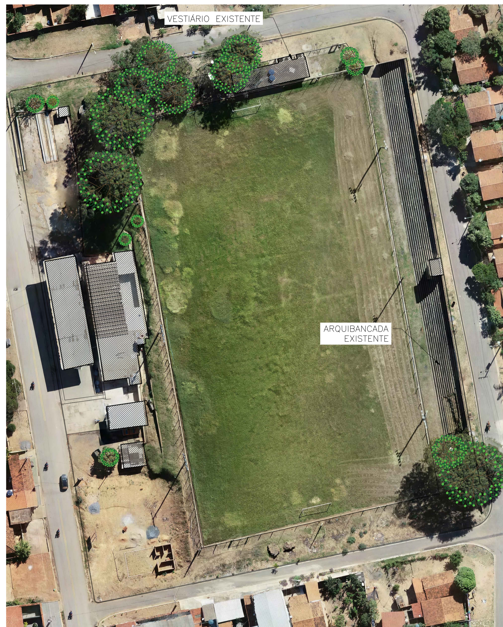
1 AS BUILT ESCALA 1:500