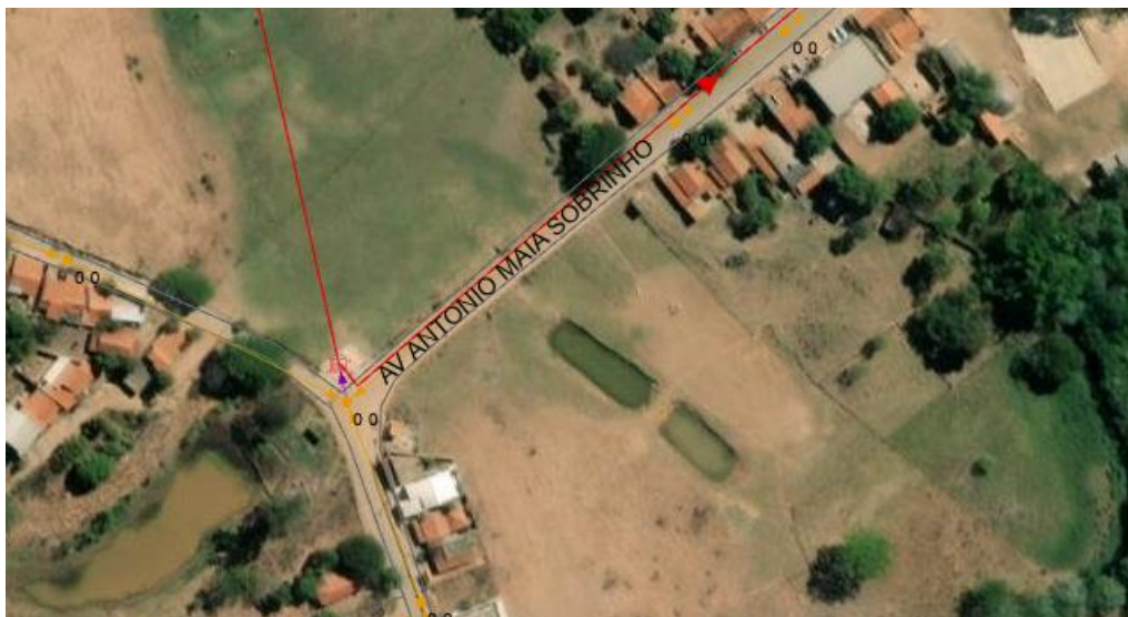
Figura 1- Rede de esgoto